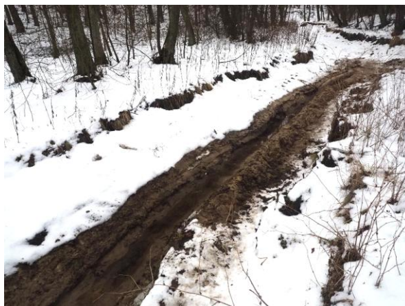
Końcowy fragment źródłowego odcinka Sztoły powyżej stawów przy Leśnym Dworze (lewe, 24.03.2026) i końcowy fragment miejskiego odcinka tej rzeki w Bukownie – widoczne ślady przekopywania koryta w celu przedłużenia przepływu wody (prawe 27.01.2026)