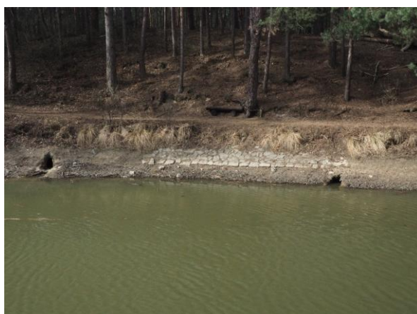
Skład pokarmu zimowego (lewe) i nory bobrów (prawe) odsłonięte po obniżeniu się poziomu wody – główny staw przy Leśnym Dworze (24.03.2026)