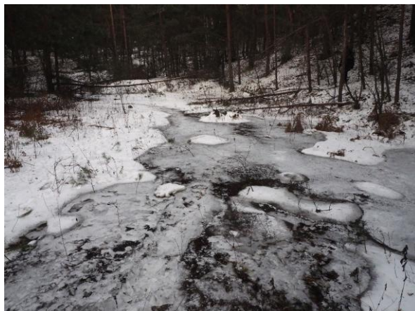
Końcowy fragment źródłowego odcinka Sztoły powyżej stawów przy Leśnym Dworze (6.01.2026)