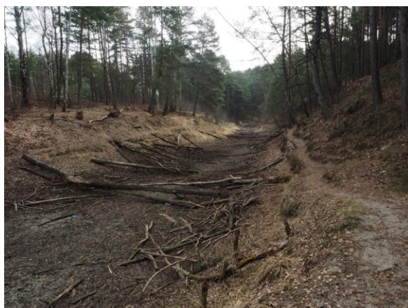
Całkowicie wyschnięty górny staw przy Leśnym Dworze (24.03.2026)