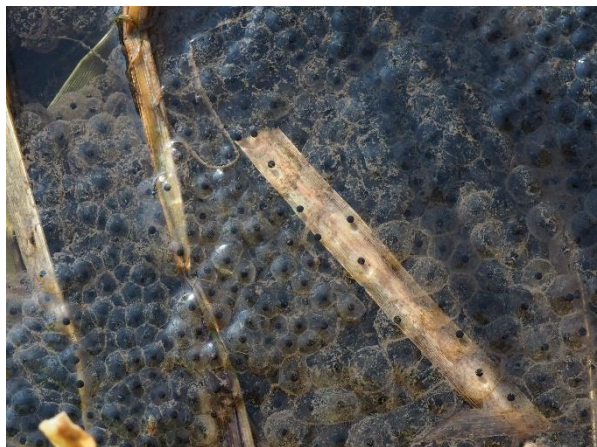
Skrzek żab z grupy brunatnych (moczarowej i trawnej) złożony bezpośrednio w korycie Białej w jej środkowym biegu (31.03.2026)