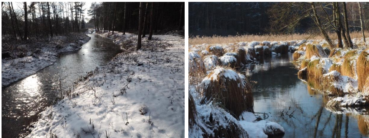
Udrożniony w końcu 2025 r. fragment Białej poniżej ujścia Sztolni Ponikowskiej i Bolesławskiej (lewe) oraz fragment koryta Białej poniżej ujścia cieku Dąbrówka (10.01.2026)

Z uwagi na nietypowe, jak na warunki klimatyczne ostatnich lat, zlodzenie wielu akwenów wodnych w Polsce, niezamarznięte ciek i zbiorniki monitorowanego obszaru były w tym czasie atrakcyjne dla ptaków wodnych. W wodach Białej, niezamarzniętych fragmentach Dąbrówki czy stawów w Laskach i zbiorników w Hutkach obserwowano w styczniu i lutym duże zgrupowania krzyżówek. Wśród nich pojawiały się pojedyncze osobniki innych gatunków kaczek, jak np. rozeniec zaobserwowany w połowie lutego przy tamie bobrowej w cieku Dąbrówka. W okresie największych mrozów na monitorowanych akwenach pojawiły się też pojedyncze kormorany.