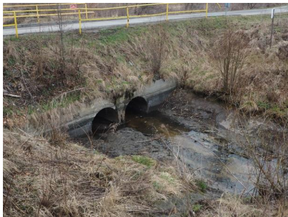
Nowa tama bobrowa w sąsiedztwie nor (lewe) i stan poziomu Dąbrówki w przepustach mostu ul. Bolesławskiej (28.03.2026)

Brak opadów, a w konsekwencji również brak większej pokrywy śnieżnej i roztopów spowodował brak nawet okresowego zasilania stawów przy Leśnym Dworze w Bukownie. Przez cały omawiany okres Baba niemal nie prowadziła wody. W efekcie odnotowano najniższy stan wody w stawach od zaprzestania pompowania wód z kopalni „Olkusz-Pomorzany”. W końcu pierwszego kwartału 2026 r. górny (tylny) staw był całkowicie suchy, a w głównym stawie były miejsca pozbawione wody.