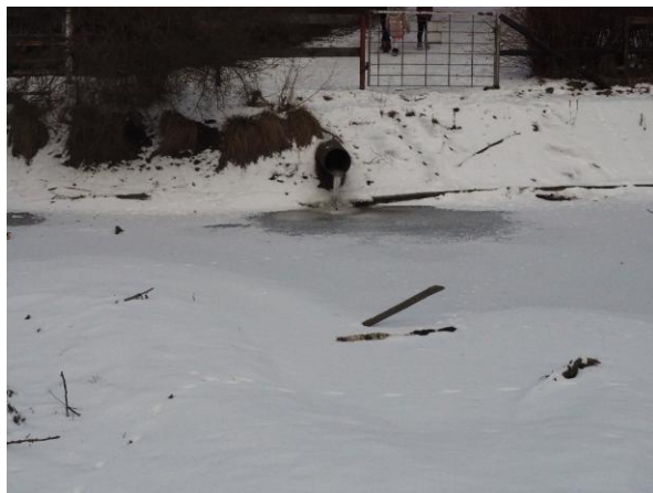
Stan napełnienia i zalodzenia głównego stawu przy Leśnym Dworze (lewe, 27.01.2026 i prawe, 6.01.2026)