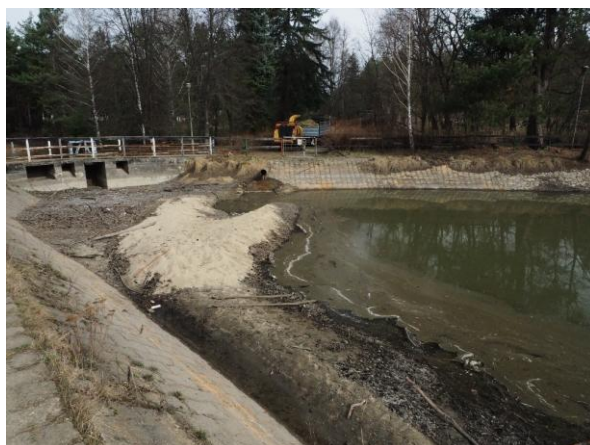
Stan napętnienia głównego stawu przy Leśnym Dworze (24.03.2026)