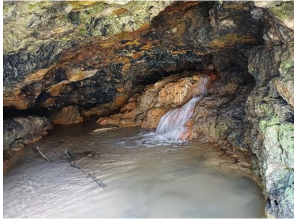
Kopuła trawertynowa (Skałka) w Laskach z widocznymi wypływami artezyjskimi – na zachodnim zboczu kopuły (lewe) oraz wewnątrz jaskini (prawe) (18.03.2026)