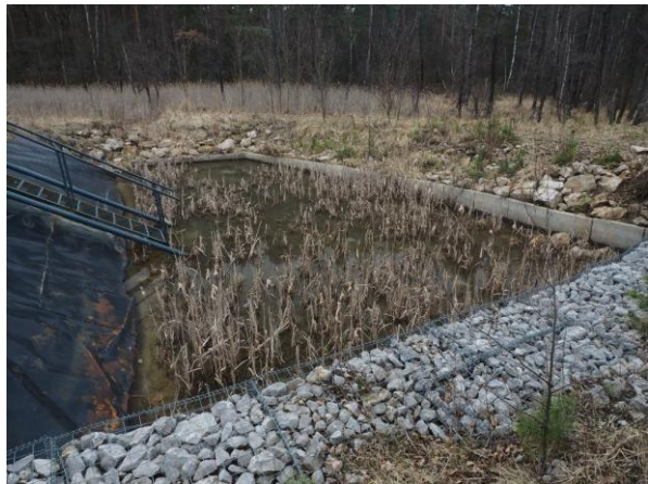
Stan napętnienia stawu nr 9 (lewe) i zbiornika ppoż (prawe) pod koniec pierwszego kwartału (28.03.2026)

Pod koniec pierwszego kwartału obserwowano początek tegorocznego okresu lęgowego płazów. Jakkolwiek, zwiększone przepływy w korytach rzecznych nie sprzyjają godom żab i ropuch, to zwiększające swoją powierzchnię zalewiska związane z podnoszeniem się poziomu wód podziemnych oraz zalewiska stworzone przez bobry stanowią atrakcyjne miejsca do rozrodu różnych gatunków płazów. Efekty tegorocznego sezonu rozrodczego będzie można ocenić w kolejnych miesiącach.