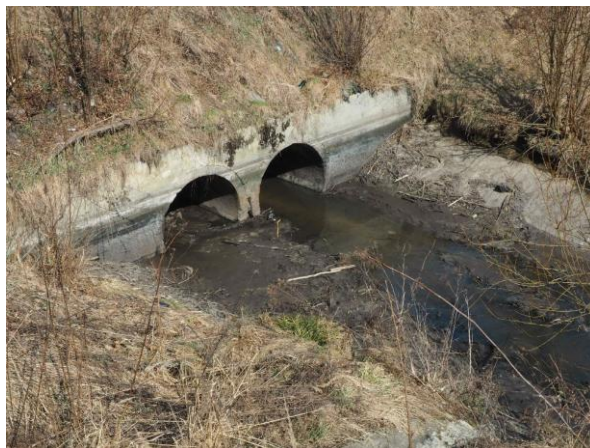
Stan cieku Dąbrówka po zakończeniu prac rozbiórkowych tamy bobrowej (18.03.2026)