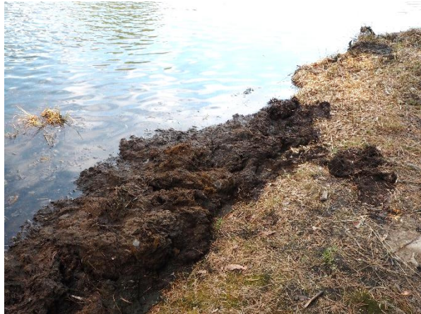
Stan tego stawu w sąsiedztwie grobli (lewe) oraz pryzmy wydobytej materii organicznej na południowym brzegu stawu (18.03.2026)

W pierwszym kwartale 2026 r. poziom wód podziemnych w dolinie Białej podniósł się na tyle, że pojawiły się one na powierzchni w górnej części stawu nr 9 i staw ten zaczął być stale zasilany. Woda jest też blisko powierzchni terenu w dawnym siedlisku przestki w obniżeniu doliny powyżej zbiornika ppoż. w Karnej. W niezmiennym stanie jest sam zbiornik ppoż.