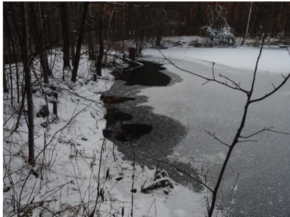
Źródło artezyjskie na grobli stawu nr 1 w Laskach (lewe, 28.03.2026) oraz strefa wypływów w dnie tego stawu (prawe, 10.01.2026)