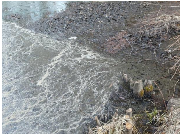
Kožuch materii organicznej w sąsiedztwie grobli stawu nr 5 w Laskach (6.03.2026)