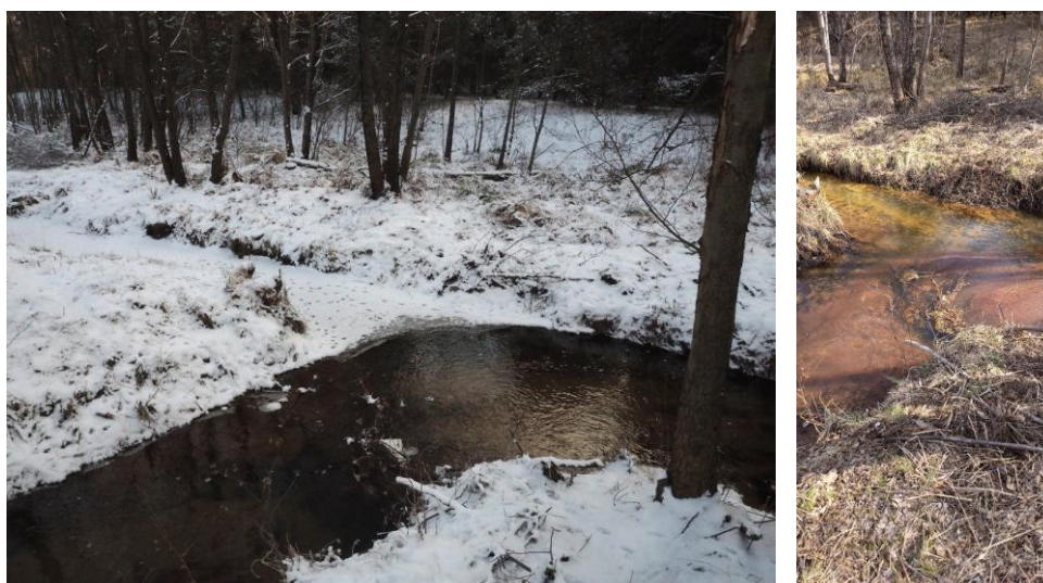
Połączenie Sztolni Ponikowskiej z Białą – widoczne zamrożone koryto Sztolni Ponikowskiej (lewe, 10.01.2026) oraz po roztopach (prawe, 18.03.2026)