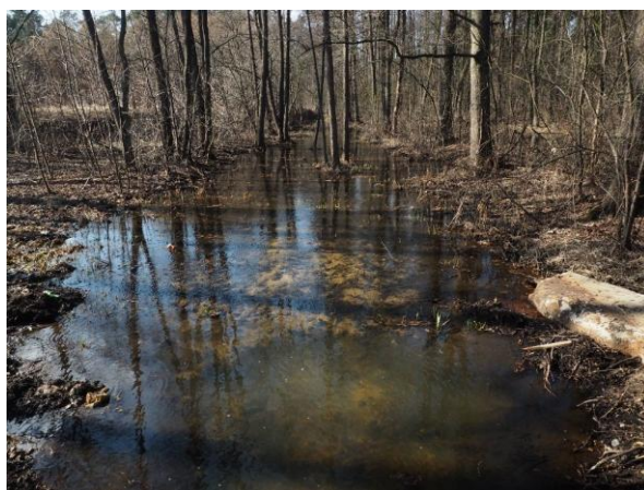
Udrożniony przepust mostu na Sztolni Ponikowskiej w Cegielni (lewe) oraz rozlewisko poniżej tego przepustu (prawe) (18.03.2026)