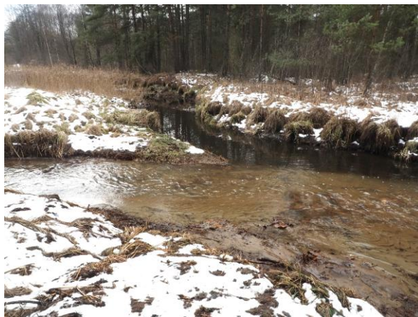
Ujście ciek Dąbrówka do Białej (lewe, 10.01.2026 i prawe, 22.02.2026)