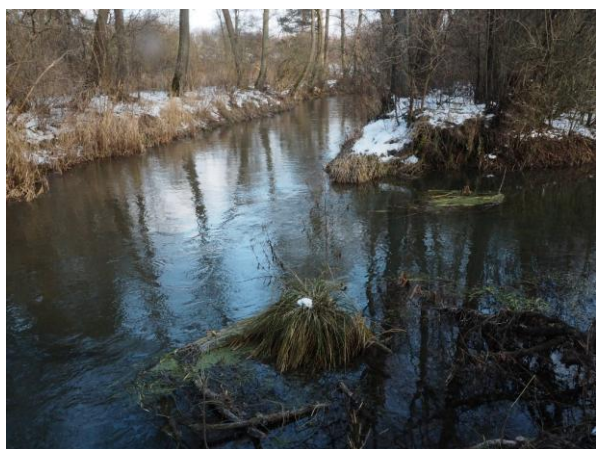
Biała Przemsza – widok z mostu w Kuźniczce Nowej (lewe) oraz ujście Białej do Białej Przemszy (prawe) (31.01.2026)