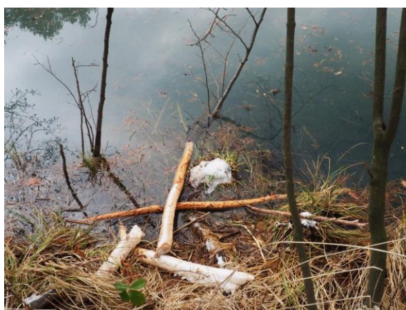
Niezamarznięte fragmenty przybrzeżne fragmenty stawu nr 4 – widoczna szczyżuka na dnie zbiornika (lewe, 2.01.2026) oraz ślady żerowania bobra (prawe, 2.01.2026)