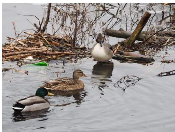
Stado krzyżówek zimujące na cieku Dąbrówka (lewe, 5.01.2026) oraz rożeniec wśród krzyżówek na tamie bobrowej w cieku Dąbrówka (prawe, 14.02.2026)