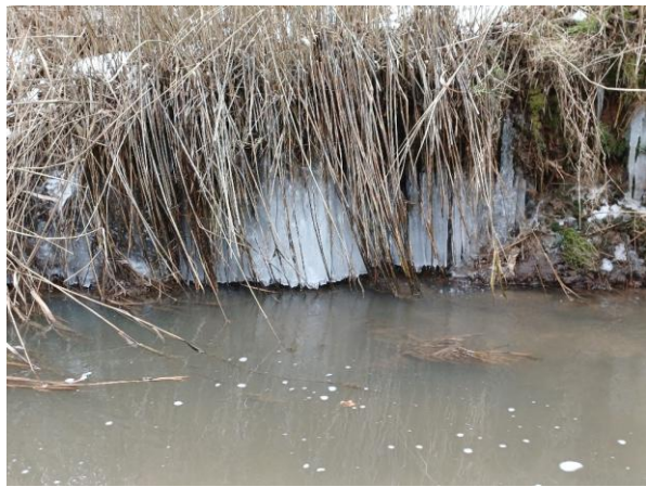
Częściowo zamrożone dopływy wód z rozlewiska na terasie rzecznej ściekających bezpośrednio do koryta Białej (22.02.2026)

Pomimo dużych mrozów, przez cały omawiany okres nie zamarła rzeka Biała i Biała Przemsza. Niezamrożony był również źródłowy odcinek Sztoly (z wyjątkiem zamarzającego fragmentu w strefie zanikania przepływu w korycie) oraz fragment odcinka miejskiego tej rzeki zasilany dopływem ze Sztolni Czartoryskiej. Poza rozlewiskami w środkowym odcinku i przy ujściu do Białej niezamrożona była Sztolnia Ponikowska. Na krótko pojawiła się pokrywa lodowa na cieku Dąbrówka.