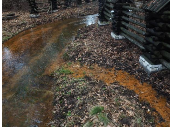
Źródła przykorytowane po północnej stronie doliny Białej w sąsiedztwie Skałki w Laskach (18.03.2026)