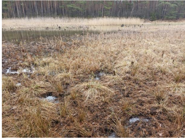
Pierwsze rozlewiska wody w górnej części stawu nr 9, które pojawiły się w wyniku podnoszenia się poziomu wód podziemnych po zaprzestaniu drenażu górniczego (28.03.2026)