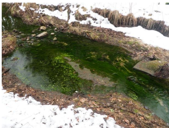
Fragment koryta Sztoły z przepływem wody poniżej ujścia roznosu Sztolni Czartoryskiej, widoczne intensywne zakwity glonów nitkowatych (27.01.2026)

Chłodny koniec roku 2025 i bardzo chłodny początek pierwszego kwartału 2026 r. były powodem zamrożenia wszystkich zbiorników wodnych w monitorowanym obszarze. Pokrywa lodowa utrzymywała się przez cały styczeń i luty, a w zacienionych miejscach nawet do marca. Niezamrożone były fragmenty stawów kompleksu Karna-Laski oraz zbiorników w Hutkach w strefach bezpośredniego zasilania wodami podziemnymi.