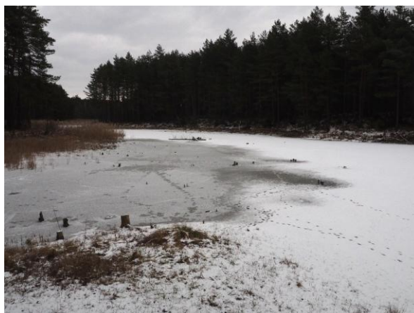
Stan pokrywy lodowej na stawach kompleksu Karna-Laski – staw nr 3 (lewe, 10.01.2026) i staw nr 9 (prawe, 2.01.2026)