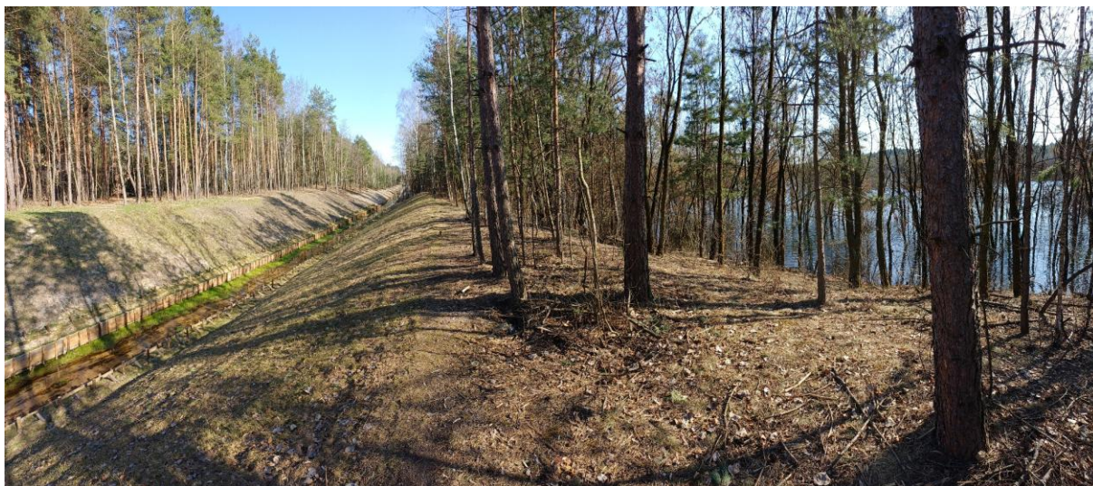
Udrożniony roznos Sztolni Ponikowskiej (z lewej) i zbiornik z podnoszącym się poziomem wody (z prawej) (18.03.2026)

W związku z podnoszącym się poziomem wód podziemnych zwiększa się przepływ wody między stawami w kompleksie Karna-Laski. Zarządzający stawami prowadzą kontrolę przepustów (mniczków) i stan napełnienia stawów wodą. Pozwala to na utrzymywanie w miarę stałego poziomu wody w tych