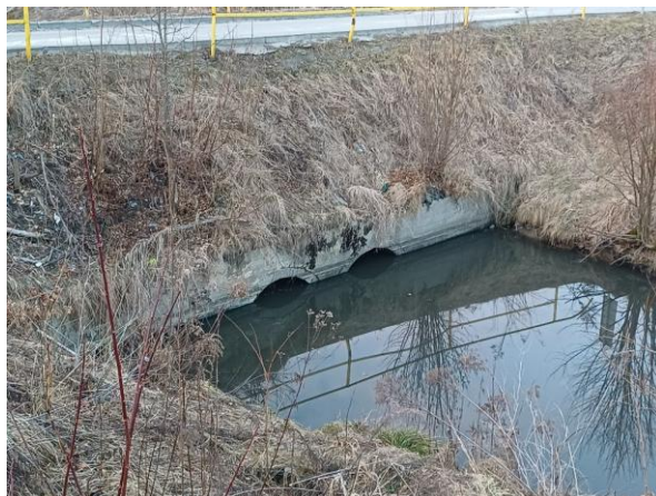
Stan głównej tamy bobrowej i poziomu wody w zalewisku w cieku Dąbrówka powyżej tamy przed rozpoczęciem prac rozbiórkowych (4.03.2026)