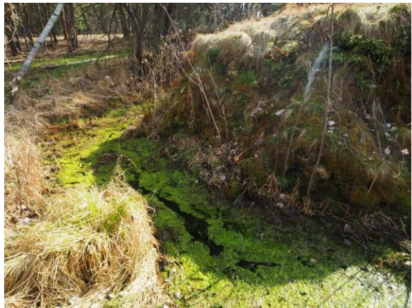
Wypływy artezyjskie na kopule trawertynowej w Laskach z widocznymi zakwitami glonów (18.03.2026)