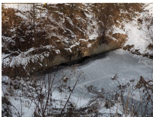
Pokrywa lodowa na cieku Dąbrówka w okolicach mostu ul. Bolesławskiej (10.01.2026)